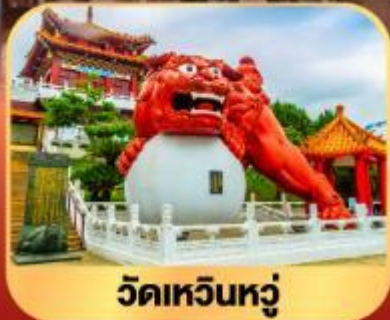
วัดเหวินหนู่