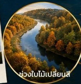
ช่วงใบไม้เปลี่ยนสี