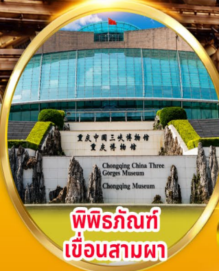
พิพิธภัณฑ์ เขื่อนสามผา