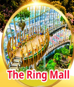
The Ring Mall