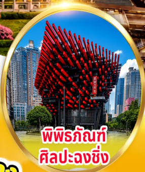
พิพิธภัณฑ์ ศิลปะฉงชิ่ง