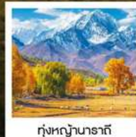
ทุ่งหญ้านาราภิ

ทัวร์คุณธรรม ไม่ลงร้านช้อปปิ้ง ไม่ขายออฟชั่น