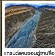
แกรนด์แคนยอนตู้ซานจือ