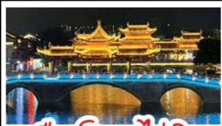
เมืองโบราณไท่ผิง