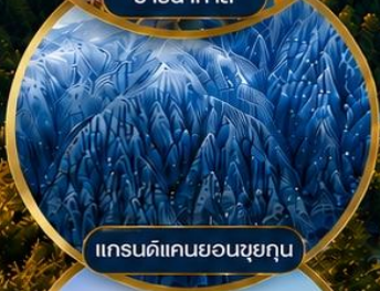
แกรนด์แคนยอนซุยกุณ