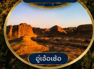
อู่เจ้อเซ่อ