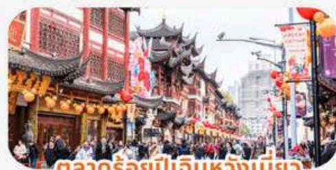
ตลาดร้อยปีเดินหวังเมี่ยว