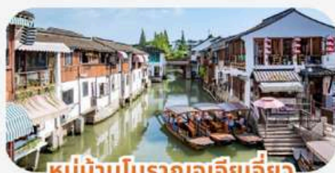
หมู่บ้านโบราณจู่เจียเจี้ยว