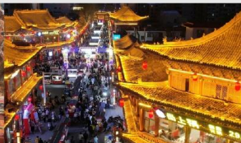
ตลาดกลางคืนจางเย่

*ทางบริษัทฯ ขอสงวนสิทธิ์ในการสลับโปรแกรมทัวร์ตามความเหมาะสมขึ้นอยู่กับสถานการณ์หน้างาน โดยคำนึงถึงผลประโยชน์ของลูกค้าเป็นสำคัญ