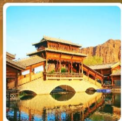
เมืองเล็กตันเสี่ยโซ่ว