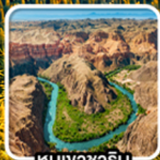
หุบเขาซาริน