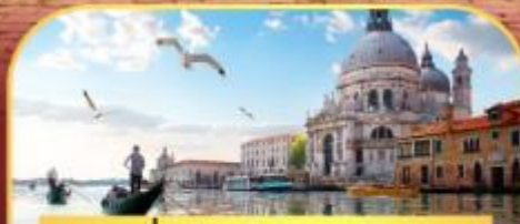
นั่งเรือสุทเกาะเวนิส