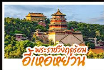
พระราชวังฤดูร้อน ฮั่วเฉาเฉาวัน