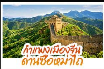
กำแพงเมืองจีน ด่านซือหม่าโต