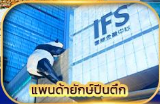
แพนด้ายักษ์ปิงตึก