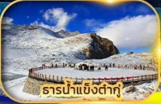
ธารน้ำแข็งท่ากู๋