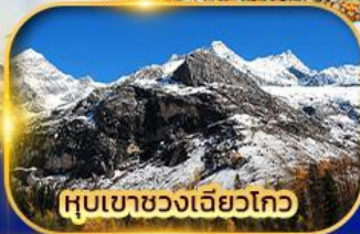
หุบเขาขวงเฉียวโกว