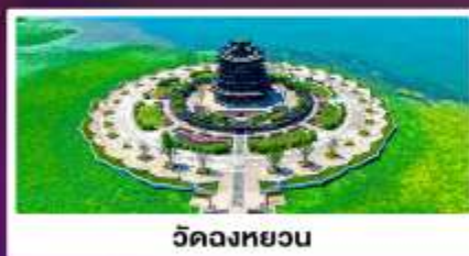
วิดงหววน