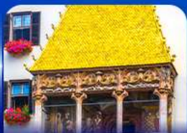
หลังคาทองคำ อินส์บรุค