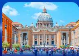
นครรัฐวาติกัน โรม