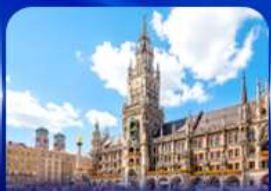
จัตุรัสมาเรียนพลักซ์ มิวนิก