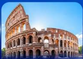
เช็กอินดัง โคโลสซียม โรม