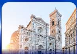
ชมเมืองแห่งศิลปะ ฟลอเรนซ์