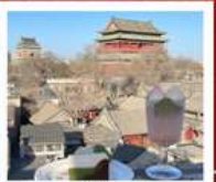
คาเฟ่ น้ำตาล