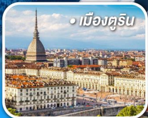
• เมืองตูริน