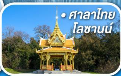
• ศาลาไทย โลซานน์

• สุดอากาศดีที่เซอร์แมท • ขึ้นกระเช้าสู่ออดจากลาเซียร์ 3000 • ชมเมืองคลาสสิกเบิร์น ลูเซิร์น ซูริก