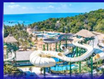
สวนสนุก Sun world Hon thom