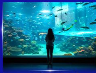
อควาเรียมยักษ์รูปเต่า