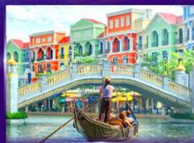
เวนิสจำลอง แกรนด์ เวิลด์