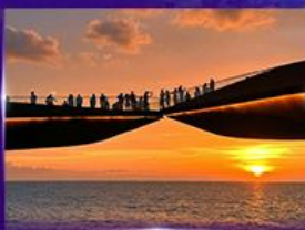
สะพานจูบ Sunset Town