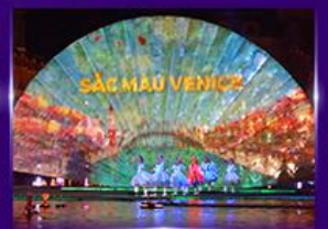
Sac Mau Venice Show