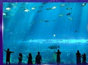
อควาเรียมยักษ์รูปเต่า