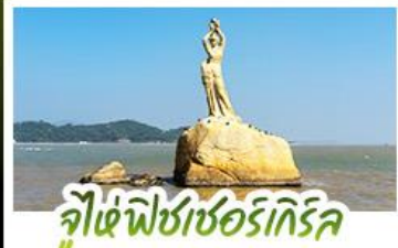
จูไห่ฟิชเชอร์เกิร์ล

ดื่มด่ำบรรยากาศสุดคลาสสิกสไตล์อังกฤษ ณ THE LONDONER MACAO ไหว้พระ-ตั้ง 3 วัตถุประสงค์ ขอพรการทำงาน การเงิน ความรัก ครอบงมในทริปเดียว ชมความวิจิตรตระการตาของพระราชวังหยวนหมิงหยวนใหม่แห่งจูไห่ ช้อปปิ้งจุใจ ย่านจิมซาจุ้ยและถนนคนเดินฟู้ทวอลล์