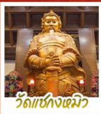
วัดเข่งงเมียว