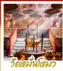
วัดเข่ม้าไทมว