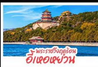
พระราชวังฤดูร้อน อ่าวเซ่ขวาน