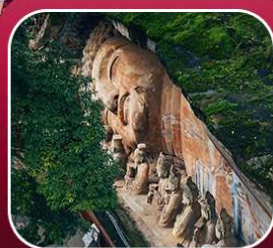
"ผาหินแกะสลักต้าจู้"