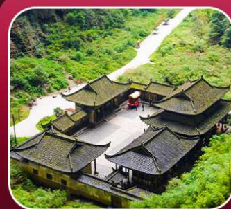
"อุทยานหลุมฟ้า"

T2G-CKG34(3U) The Best Chongqing...ฉงชิ่ง ต้าจู้ อุ้หลง เขานางฟ้า 5D 4N (3U)