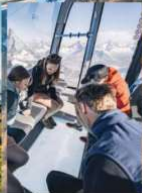
Matterhorn Glacier Paradise