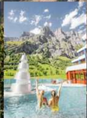
แช่สปปาลอยเทอรันา