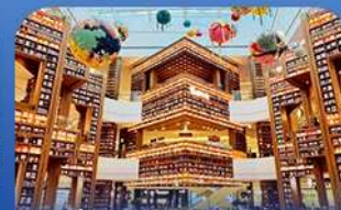
ห้องสมุดคSTARพีค