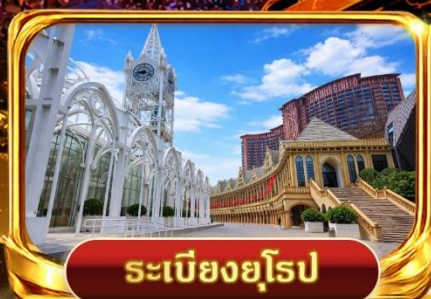
ระเบียงยุโรป