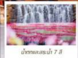
น้ำตกทะเลสาบไห่ 7 สี