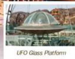
UFO Glass Platform