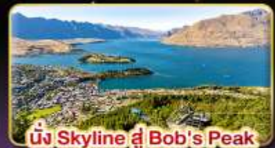
นั่ง Skyline สู Bob's Peak