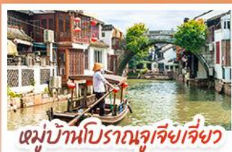
หมู่บ้านโบราณซูเจียงเจี๋ย

สวนสนุกเซี่ยงไฮ้ดิสนีย์แลนด์ เต็มวัน (รวมรถรับ-ส่ง)