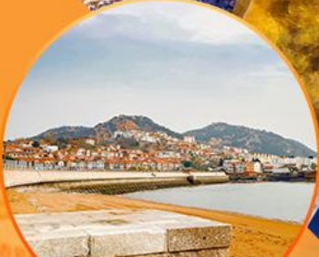
ซาจื่อโป่ว