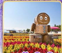
สวนซึกิไซโนะโอะกะ