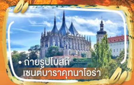
• ถ่ายรูปโบสถ์ เซนต์บาราคุกนาโอรา