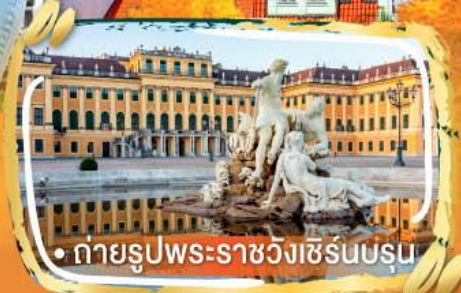
• ถ่ายรูปพระราชวังเซิร์นบรุน