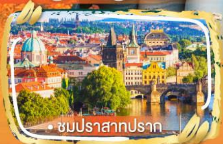
• ชมปราสาทปราก