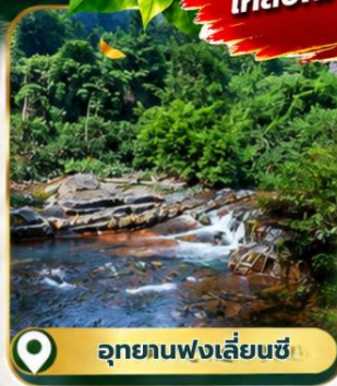
อุทยานฟ่งเลี่ยนซี