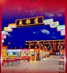
ตลาดกลางคืน ทาลาเดอซี