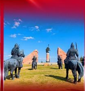
สวนสาธารณะเจกทึส贊