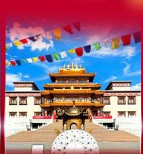
วัดพระโพธิสัตว์ ดูลาน