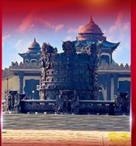
ศูนย์วัฒนธรรม มองโกเลีย หยวนหลิว