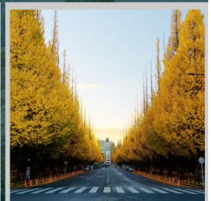
“ICHONAMIKI GINGO AVENUE”