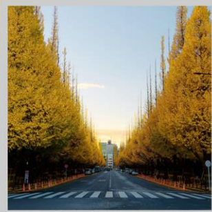
“ICHONAMIKI GINGO AVENUE”