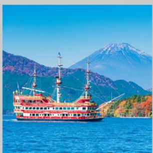
“ASHI CRUISE 30 MINS”