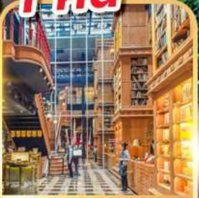
ร้านไอศกรีมมियाฮาร่า