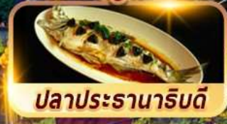
ปลาประรานาริบตี