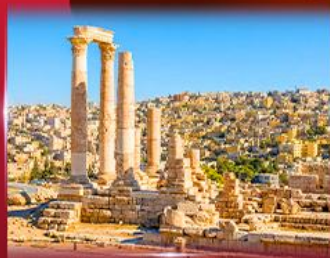
ป้อมปราการอันมาน