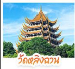
วัดเลิ่งฉวน