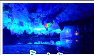
กำแพงสุ่ยอ้อ

เขานู้อี้+สะพานแดง - ล่องเรือแม่น้ำหลี่เจียง หน้าบันไดสีทองอร่าม - กำแพงสุ่ยอ้อ - ทางวงช้าง เจดีย์เงินเจดีย์ทอง - รถไฟความเร็วสูง เบบูพิเศษ บุฟเฟ่ต์ย่างบาร์บีคิว ปลาอบเบียร์ เมื่อคริสตัส สุกี่ทีด