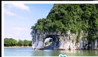
ทางวงช้าง