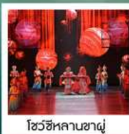
โชว์ซีหลานซาตู้