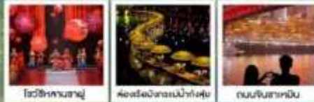
โชนซึหาคานซาญุ่