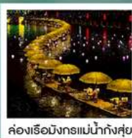
ห้องเรือมังกรแม่น้ำก้งซู่