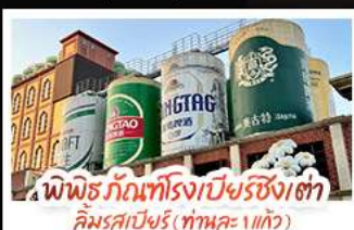
พิพิธภัณฑ์โรงเบียร์ชิงเต่า คิมรตเบียร์ (ทานคะ 1 แก้ว)