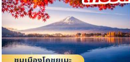
ชมเมืองโคซุยูเมะ