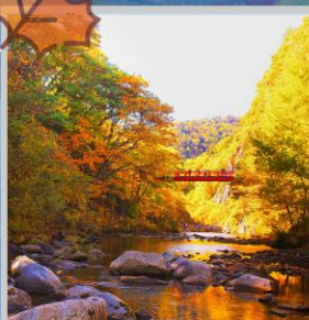
"JOZANKEI FUTAMI BRIDGE"