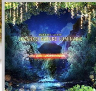
“JOZANKEI NATURE LUMINARIE”