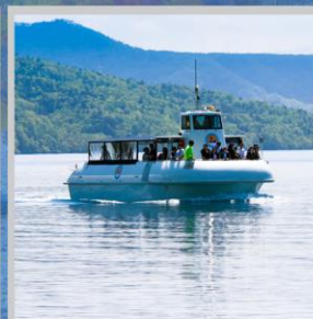
"LAKE SHIKOTSU GLASS BOAT"