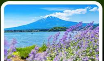
สวนโอบิชิ ปาร์ค