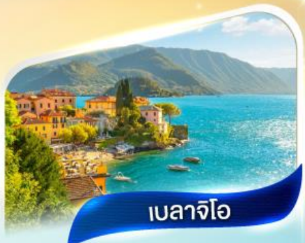
เบลาจีโอ