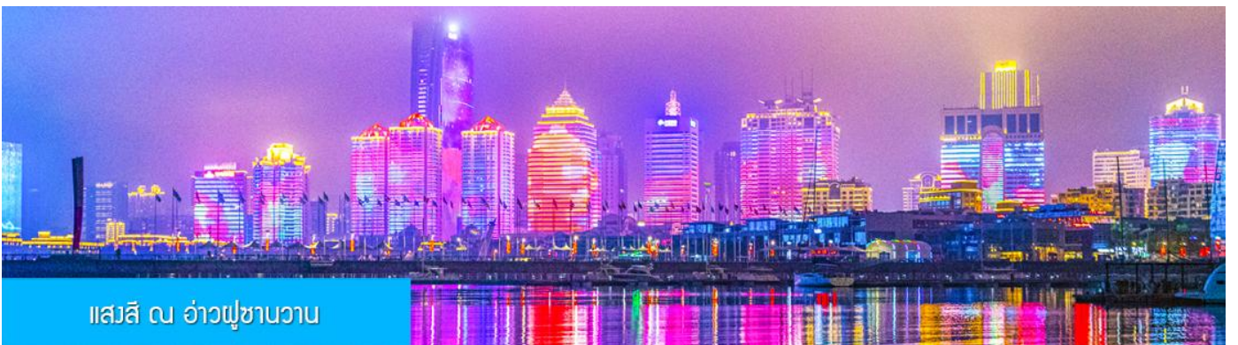
แอสสิ ณ อ่าวฟูซานวาน

ถ้า รับประทานอาหารค่ำ ณ ภัตตาคาร *เมนูซีฟู้ด (3)