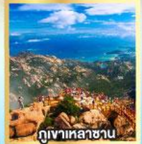
กุหาเหลาซาน