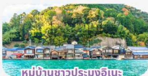
หมู่บ้านชาวประมงอินะ