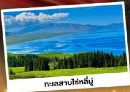
ทะเลสาบไซท์สัมนู

ชมวิวดอกดัลการแบบยุโรปผสมเอเชีย กุ้งหน्यानียวดำ ทะเลสาบสีเทอร์ควอยซ์