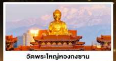
วัดพระใหญ่ทวงกงซาน