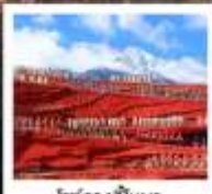
โชว์จางอีหนว

พิเศษ!! รวมค่าเช่าชุดพื้นเมือง ...ที่เมืองโบราณลี้เจียง