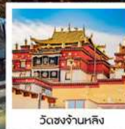
วัดชงจ้านหลิง

“ขบวนรถไฟความเร็วสูงจากต้าหลี่ไปคุนหมิง”